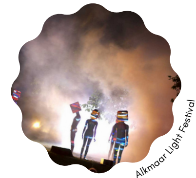
Alkmaar Light Festival

Dompel je onder in de verlichte stad. De de wintertijd is net ingegaan en Alkmaar verandert in één groot lichtspektakel. Met lichtshows op gebouwen, muziek, live theater en bijzondere lichtobjecten in straatjes en op pleinen beleef je de stad zoals je dat niet eerder deed. alkmaarlightfestival.nl