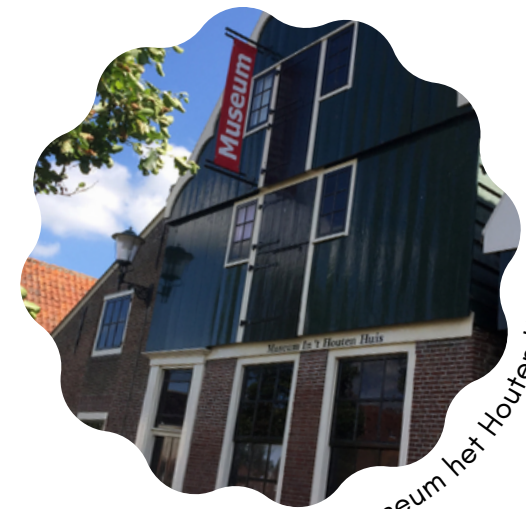
Museum het Houten Huis