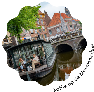
Koffie op de bloemenschuit

Kleine unieke shops, concept stores, vintage mode, sieraden en brocante afgewisseld met high-end fashion.