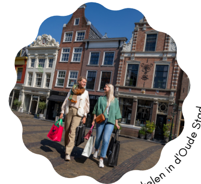
Winkelen in d'Oude Stad

Overdekt winkelen voor sportieve gezinnen en altijd plek om te parkeren. De oude chocoladefabriek van Alkmaar wordt omgetoverd tot winkel- en horeca hotspot. Ook huist hier het Alkmaarse Stadstrand en kun je heerlijk vertoeven aan de kade.