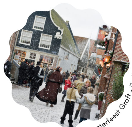
Midwinterfeest Graft - De Rijk